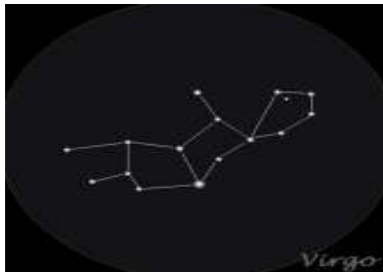
(the constellation Virgo)

The zodiac sign of Elul is besula (Virgo)